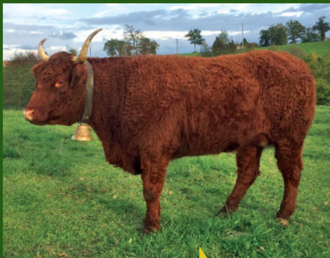
Génisse de 30 mois Fille de NOGENT ÉLEVAGE JF DELPUECH