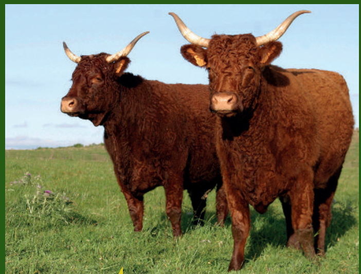
2 filles de SÉDUCTEUR EARL LAMOUROUX

Une sélection sur le phénotype : des résultats concrets Conformation des bassins, ligne de dos, GMQ, lait, Qualités de race... UNE SÉLECTION GAGNANTE DE GÉNÉRATION EN GÉNÉRATION