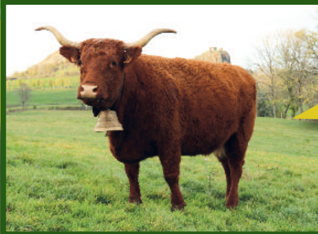
LORRAINE GAEC BEYLE