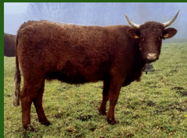
Velle de 9 mois ÉLEVAGE G. DELPUECH